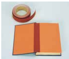
見返用紙の色に合わせてお選びください。