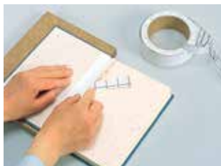
剥離紙を片側ずつはがして貼ります。