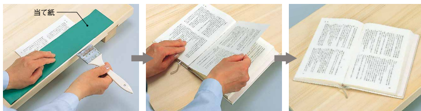
作業台の段差を使い、当て紙の上からのりをページ数、天地に気をつけて貼ります。完成です。

ページが1枚外れた時は、綴じる部分を切りそろえて刷毛でのり付けし、のどに貼りつけます。最後に重しをするか、プレス機に挟んで完成です。