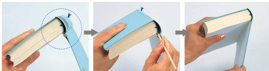
のりステッキでつなぎの部分のみ、のりを入れます。完成です。