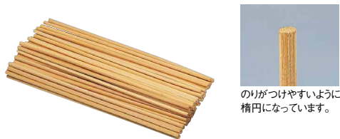
のりがつけやすいように楕円になっています。