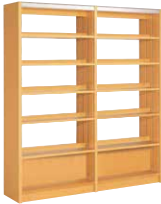
302-263 / 直立複式 2連6段