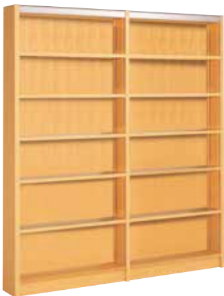
301-263 / 直立単式 2連6段

書架天板見出部分にアルミ合金を採用し、棚下にもブックサポート用レールを付けて、使いやすさを向上させています。 ■ 棚板の積載重量は40kg(JIS規格1種相当)です。