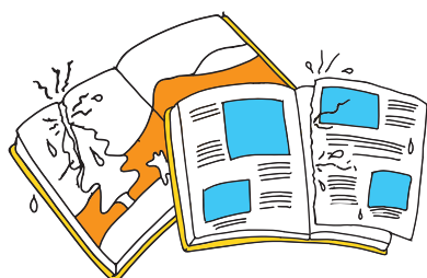
ページが破れている時 / とれている時