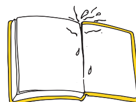
表紙や見返しが破れている時