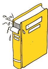
背表紙が破れている時