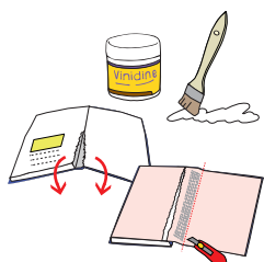
糊の作り方 補修の前準備