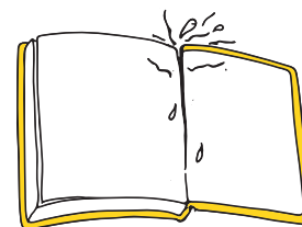
表紙や見返しが破れている時